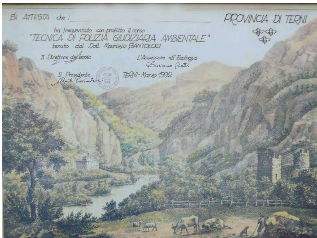
Un attestato del corso in occasione di un seminario tenutosi nel 1992